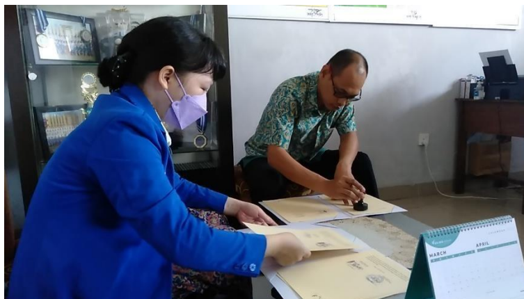
Gambar 1. Penantangan Nota Kerjasama dan Nota Kesepahaman

Bodhi Dharma) dan Perjanjian (antar Fakultas Komputer dan SMAS Bodhi Dharma). Setelah kegiatan penandatanganan nota kesepahaman dan perjanjian selesai, dilanjutkan kegiatan sosialisasi dan promosi. Setelah kegiatan sosialisasi dan promosi, maka dilanjutkan dengan kegiatan pelatihan.