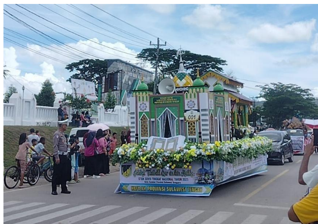
Gambar 1. Kendaraan hias Provinsi Sulawesi Tengah menampilkan maket masjid, busana adat Kaili, serta alat musik tradisional yang merepresentasikan integrasi nilai religius dan identitas budaya lokal.

memperkuat pengalaman kolektif melalui unsur audio yang menarik perhatian masyarakat.