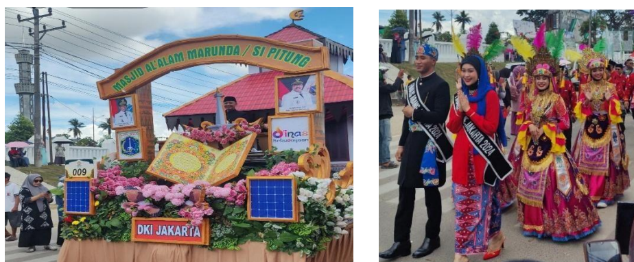
Gambar 4. Kendaraan hias DKI Jakarta menampilkan miniatur Monas dan busana Betawi sebagai simbol integrasi budaya lokal dengan nilai modernitas dan kepedulian lingkungan.

Secara konseptual, fenomena ini juga dapat dipahami melalui pendekatan semiotika Roland Barthes (2009) yang menyatakan bahwa simbol tidak hanya memiliki makna denotatif, tetapi juga makna konotatif yang berkaitan dengan nilai, ideologi, dan identitas sosial. Dalam konteks pawai STQH, kendaraan hias tidak sekadar menampilkan bentuk visual, tetapi juga mengandung pesan budaya yang lebih dalam mengenai identitas daerah, nilai religius, dan hubungan manusia dengan lingkungan.