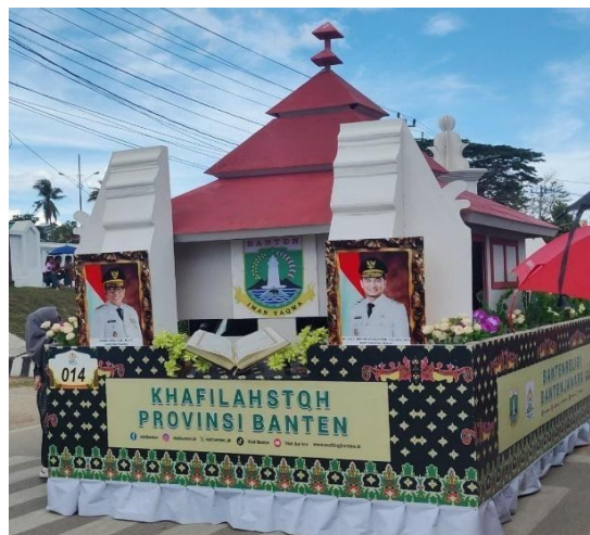
Gambar 3. Kendaraan hias Provinsi Banten memperlihatkan slogan religius dan busana adat yang mencerminkan identitas masyarakat religius dan berjiwa perjuangan.

Provinsi Banten menonjolkan slogan “Religi dan Jawara” sebagai dualitas identitas. Kombinasi tersebut muncul dari sejarah sosial masyarakat Banten yang menggabungkan religiusitas dengan semangat perjuangan. Penggunaan busana adat dan miniatur bangunan bersejarah berfungsi untuk memperkuat narasi tersebut dalam bentuk visual.