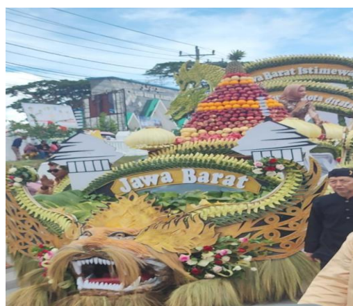
Gambar 2. Kendaraan hias Provinsi Jawa Barat memperlihatkan kutipan religius, busana tradisional, serta ornamen berbasis material alami yang

Jawa Barat menonjolkan pesan kerukunan dan lingkungan melalui kutipan religius serta penggunaan material alami. Pemilihan tersebut menunjukkan adanya kesadaran ekologis yang disesuaikan dengan tema acara. Proses perakitan kendaraan yang menggunakan bahan alam mencerminkan praktik keberlanjutan sekaligus menegaskan bahwa identitas budaya dapat diwujudkan melalui pendekatan ramah lingkungan. Kendaraan hias dalam festival budaya berfungsi sebagai media komunikasi simbolik yang memperlihatkan identitas sosial dan budaya daerah (Putra & Wibowo, 2023).